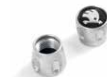
Ozdobne nakrętki wentyli