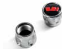
Ozdobne nakrętki wentyli RS